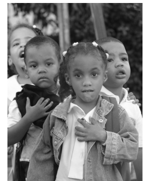
Los niños Instituto de Ayuda al Sordo Santa Rosa, Santo Domingo.

Todos los que nos encontramos en este campo de trabajo tenemos, si queremos, la capacidad para cambiar y comprender que la educación del sordo está a años luz de muchas de las cosas que aprendimos. La base está en retirar de nosotros mismos toda una serie de prejuicios y en tener una mente abierta al aprendizaje continuo. Entender que los padres son la piedra angular de nuestro trabajo y que de ellos aprendemos lo que no se nos enseña en ninguna universidad. Que son ellos y a través de sus hijos los que nos hacen ser mejores profesionales, pero sobre todo, mejores seres humanos. ◇